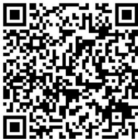
FAQ des Kultusministe- riums zum Coronavirus

https://www.rki.de/DE/Content/InfAZ/N/Neuartiges_Coronavirus/nCoV.html